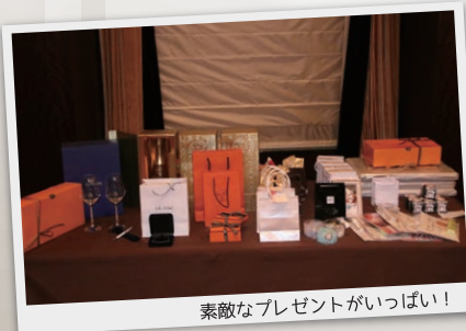
素敵なプレゼントがいっぱい!