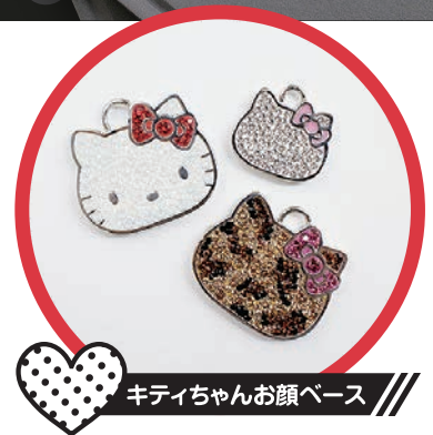
キティちゃんお顔ベース

※これらの商品を使って制作された作品を、商品として販売することは禁止されています。 ※ハローキティの名称を広告等で利用することはできません。