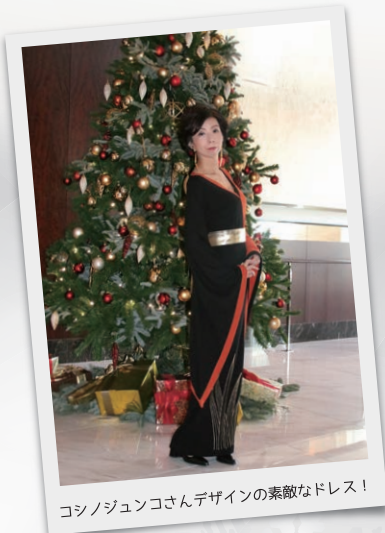
コシノジュンコさんデザインの素敵なドレス!