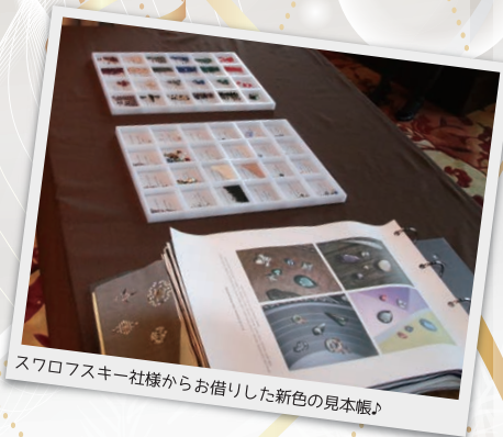
スワロフスキー様からお借りした新色の見本帳♪