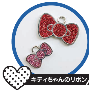
キティちゃんのリボン