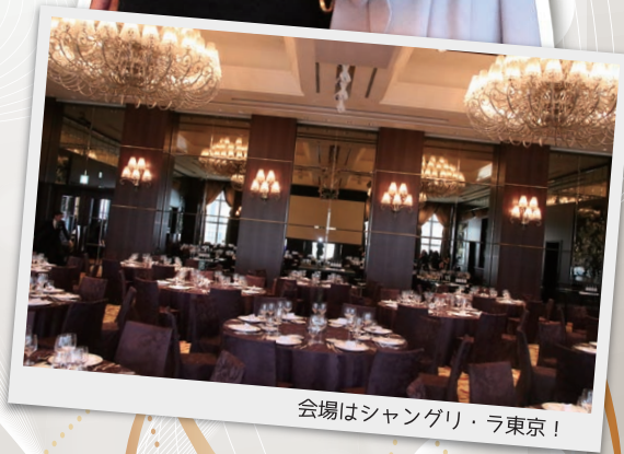
会場はシャングリ・ラ東京!

どなたにもらっていただいたんだろう、と協賛していただいた方もドキドキされていると思いますので、 ぜひ、当選された方はブログなどでご紹介くださいね~!!