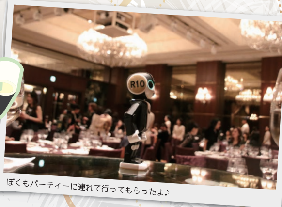
ぼくもパーティーに連れて行ってもらったよ!