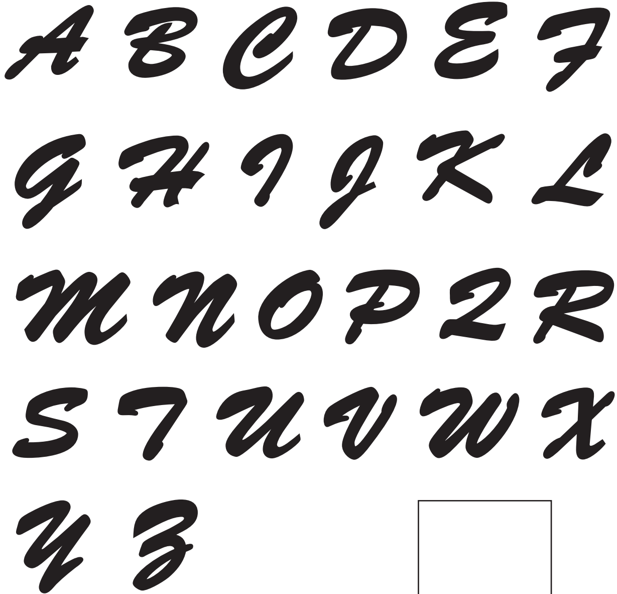
イニシャル用グルー